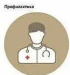
Профилактика производится путем вакцинации. Лица, находящиеся в контакте с больными животными, подлежат врачебному наблюдению в течение 2 недель.