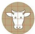
Выявленных больных животных следует изолировать, а их трупы сжигать; инфицированные объекты – обеззараживать.