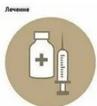
Независимо от формы болезни лечение состоит в использовании противосибирского глубинного и антибиотиков. Лечение начинается срочно.

Трупы животных, павших от сибирской язвы, быстро разлагаются и поэтому обычно вздуты, окоченение в большинстве случаев не наступает или выражено слабо. Из естественных отверстий вытекает кровянистая жидкость.